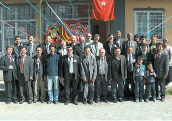
Denizli şubemize bağlı Cıvırl İlçe temsilciliğinin açılışı, görkemli bir törenle yapıldı.